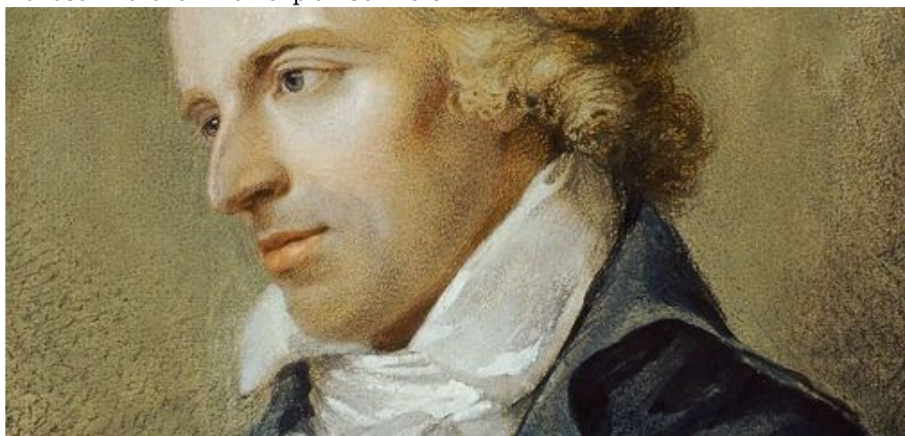
Porträt Schillers von Ludovike Simanowitz, 1794