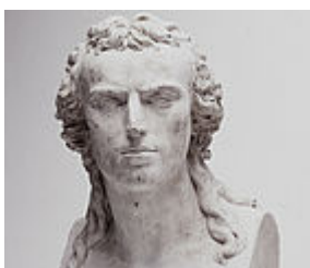
Friedrich Schiller. Büste von Johann Heinrich Dannecker, 1905

Von Friedrich Schiller, Namenspatron sowohl des Trägervereins als auch des dem Deutschen Literaturarchiv vorangehenden »Schiller-Museums«, stammt der historisch zentrale Bestand der Marbacher Institute. Der schriftliche Nachlass Schillers wird seit dem Jahr 1889 in Weimar verwahrt, dagegen haben sich in Marbach bereits von 1859 an allerlei Schriftstücke von, an und über Schiller angesammelt, die im Lauf der Jahrzehnte