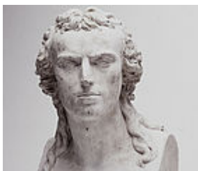
Friedrich Schiller. Büste von Johann Heinrich Dannecker, 1905

Von Friedrich Schiller, Namenspatron sowohl des Trägervereins als auch des dem Deutschen Literaturarchiv vorangehenden »Schiller-Museums«, stammt der historisch zentrale Bestand der Marbacher Institute. Der schriftliche Nachlass Schillers wird seit dem Jahr 1889 in Weimar verwahrt, dagegen haben sich in Marbach bereits von 1859 an allerlei Schriftstücke von, an und über Schiller angesammelt, die im Lauf der Jahrzehnte