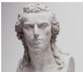
Friedrich Schiller. Büste von Johann Heinrich Dannecker, 1905

Von Friedrich Schiller, Namenspatron sowohl des Trägervereins als auch des dem Deutschen Literaturarchiv vorangehenden »Schiller-Museums«, stammt der historisch zentrale Bestand der Marbacher Institute. Der schriftliche Nachlass Schillers wird seit dem Jahr 1889 in Weimar verwahrt, dagegen haben sich in Marbach bereits von 1859 an allerlei Schriftstücke von, an und über Schiller angesammelt, die im Lauf der Jahrzehnte und bis heute durch Stiftungen und Zukäufe kontinuierlich vermehrt worden sind. Damit bewahrt das Deutsche Literaturarchiv neben dem Weimarer Goethe- und Schiller-Archiv die bedeutendste Überlieferung zu Friedrich Schiller überhaupt.