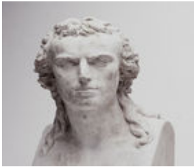
Friedrich Schiller. Büste von Johann Heinrich Dannecker, 1905

Von Friedrich Schiller, Namenspatron sowohl des Trägervereins als auch des dem Deutschen Literaturarchiv vorangehenden »Schiller-Museums«, stammt der historisch zentrale Bestand der Marbacher Institute. Der schriftliche Nachlass Schillers wird seit dem Jahr 1889 in Weimar verwahrt, dagegen haben sich in Marbach bereits von 1859 an allerlei Schriftstücke von, an und über Schiller angesammelt, die im Lauf der Jahrzehnte und bis heute durch Stiftungen und Zukäufe kontinuierlich vermehrt worden sind. Damit bewahrt das Deutsche Literaturarchiv neben dem Weimarer Goethe- und Schiller-Archiv die bedeutendste Überlieferung zu Friedrich Schiller überhaupt.