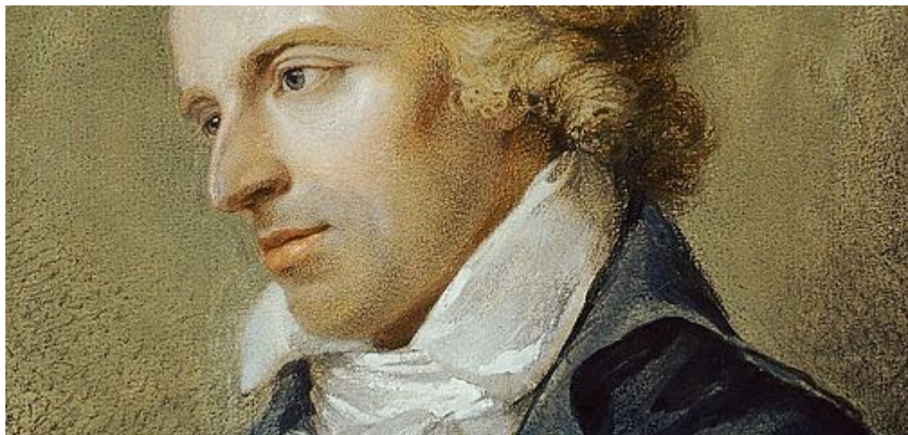
Porträt Schillers von Ludovike Simanowitz, 1794