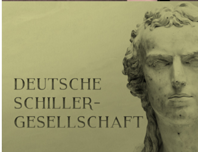
Schillerrede 2017 zum Nachhören