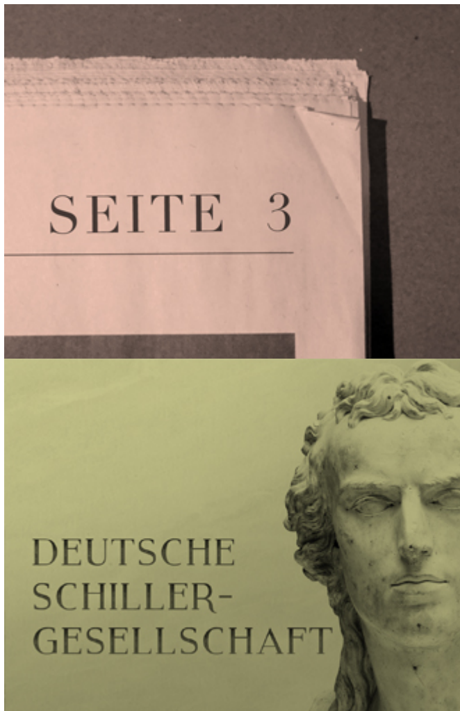
Schillerrede 2017 zum Nachhören